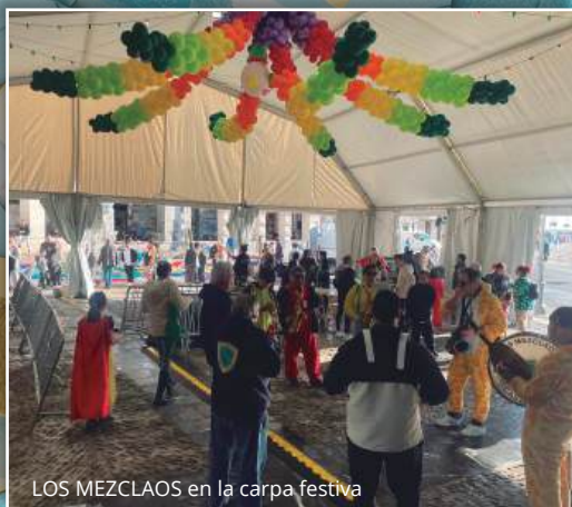
LOS MEZCLAOS en la carpa festiva