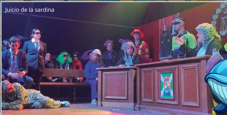
Juicio de la sardina