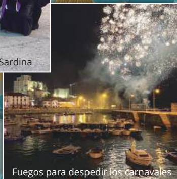
Fuegos para despedir los carnavales