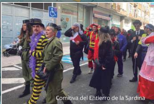
Comitiva del Entierro de la Sardina