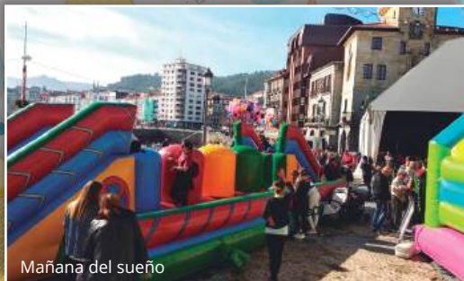
Mañana del sueño

Carpa del Ayuntamiento: Actividades para toda la familia. Hinchables, fotomatón, talleres.