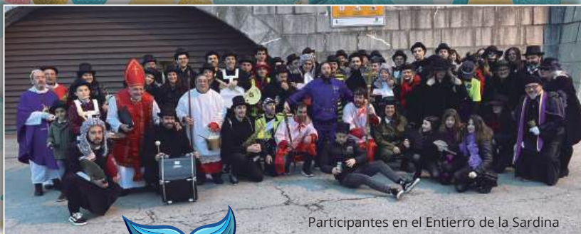
Participantes en el Entierro de la Sardina

Una vez ya con el Sardino en las aguas de nuestra bahía, lanzaremos un castillo de fuegos artificiales para despedir estos carnavales.