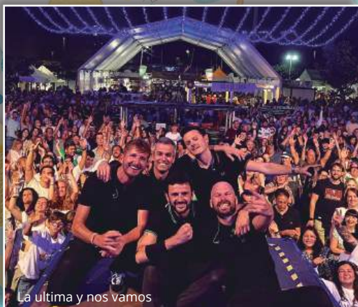
La última y nos vamos

Carpa del Ayuntamiento: música en directo con el grupo LA ÚLTIMA Y NOS VAMOS , que nos harán disfrutar con su gran puesta en escena con versiones de los grandes éxitos del pop, rock e indie en castellano.