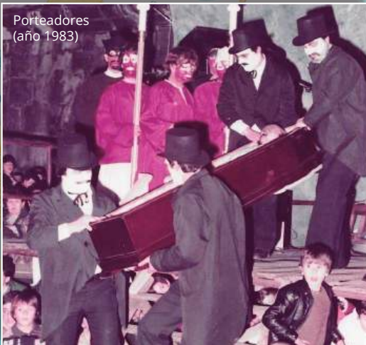
Porteadores (año 1983)

13:00h. Pasacalles musical con amigos de Castro Peña junto a la comitiva del Entierro de la Sardina, para ir entrando en calor y dando el ambiente a este "triste" día. Calle San Juan, Arturo Dúo, Nª Señora, San Francisco, Santander, Ardigales, La Mar, Paseo del Puerto y finalizar en la plaza del Ayto.